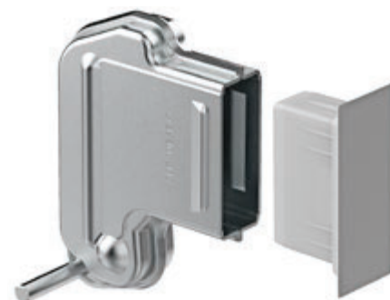
Die neue ASK-Sicherheitsaussparung mit Montagezapfen.

Alle Produkte aus der Albanese-Ideenschmiede sind unter dem Aspekt rationeller Bauabläufe