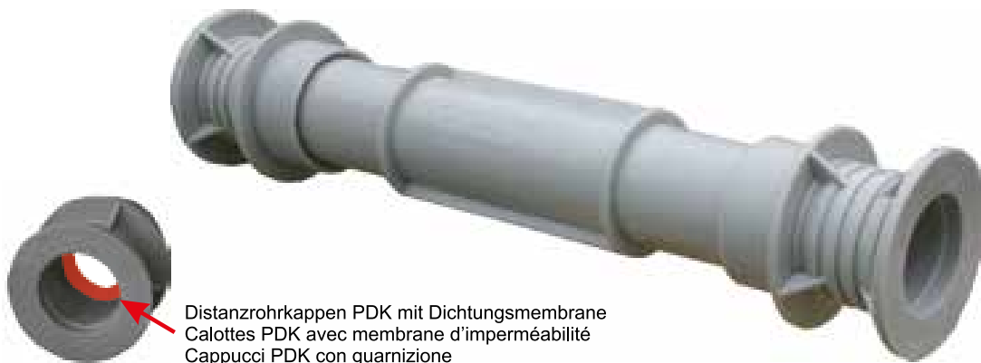
Distanzrohrkappen PDK mit Dichtungsmembrane Calottes PDK avec membrane d'imperméabilité Cappucci PDK con guarnizione

Forniamo i nostri tubi distanziali PDK completamente montati in cartoni robusti e resistenti alle influenze atmosferiche da 100pz. I nostri cappucci impermeabili in materiale sintetico e di elasticità permanente preservano i casseri ed impediscono la penetrazione dell'acqua del calcestruzzo. Le guarnizioni sul esterno dei tubi distanziali impediscono la penetrazione dell'acqua al interno del fabbricato.